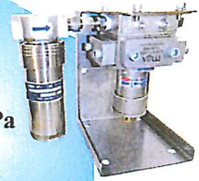
Model 214/295 (EX295) 流量レンジ：0.3~600L/Hr 出力：90p/cc ±10VDC ±4~20mA