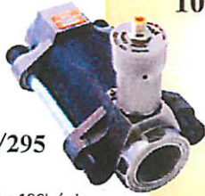
Model 241/295 (EX295) 流量レンジ：0.1~180L/min 出力：15p/cc ±10VDC ±4~20mA