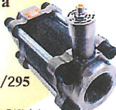
Model 242/295 (EX295) 流量レンジ：1~540L/min 出力：5p/cc ±10VDC ±4~20mA