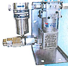
Model 213/295 (EX295) 流量レンジ：1~1800cc/min 出力：1000p/cc ±10VDC ±4~20mA